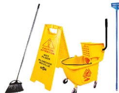
Vadrouilles, seaux, balais, chariots, tapis