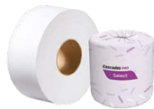
Essuie-mains, papier hygiénique et distributrices