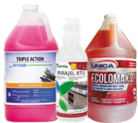
Produits nettoyants, désinfectants et dégraissants

Que ce soit pour vos planchers, surfaces, salles de bain, cuisines ou aires communes, nous avons tout ce qu'il vous faut pour maintenir un environnement impeccable et sécuritaire :