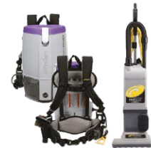
Aspirateurs, balayeuses et auto-récureuses